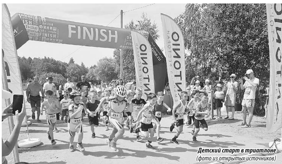
Детский старт в триатлоне (фото из открытых источников)