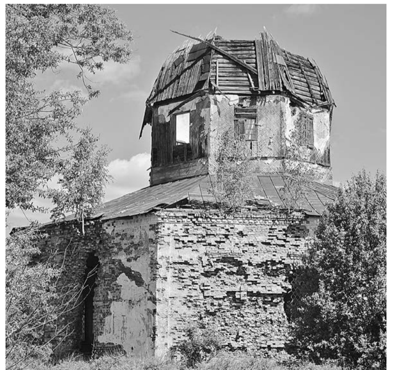
В Никольском храме в Волоке крестился в 1820 году выдающийся промышленник Николай Путилов

И, возможно, установка мемориала станет ещё одним шагом на пути к возрождению Никольского храма.